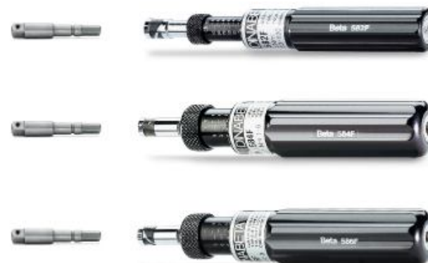
MIERNIK MOMENTU OBROTOWEGO WSKAZ.