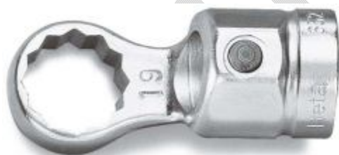
GŁOWICA Z KLUCZEM OCZKOWYM