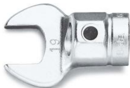
GŁOWICA Z KLUCZEM OCZKOWYM