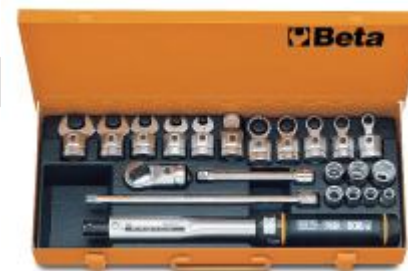
KRZYNKA DO KLUCZA